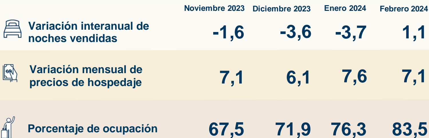
Porcentaje de ocupación según zona geográfica (%)