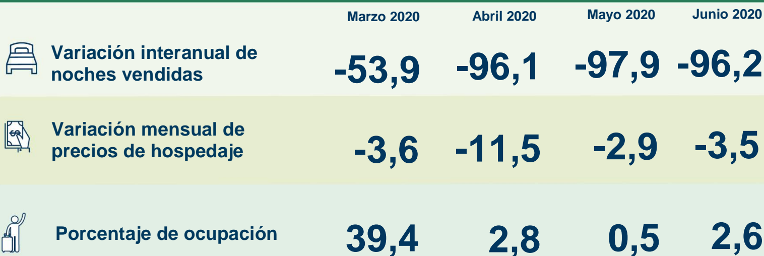
Porcentaje de ocupación según zona geográfica (%)